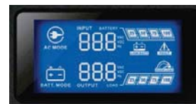
Panel de control y monitoreo LCD Nivel de carga/Nivel de Baterías Voltaje de entrada y salida/Frecuencia de salida Temperatura del equipo